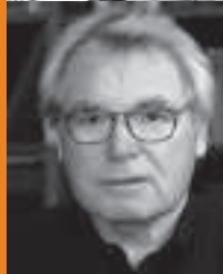
Prof. Dr. Oskar Negt Universität Hannover